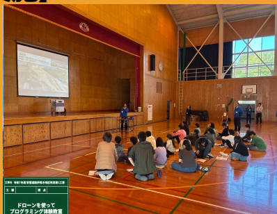
ドローンを使って プログラミング体験教室

11月20日に伊尾木小学校にて伊尾木小学校・下山小学校合同のドローンを使ったプログラミング教室を実施しました。 今回の工事や土木についての説明をした後、タブレットを使用しドローンを自由に飛ばしたり、プログラミングを行い決まったコースを飛ばす体験をしていただきました。