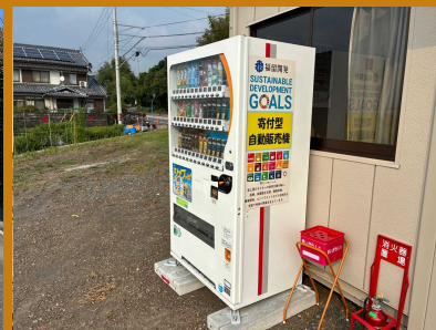
チャリティ自販機設置