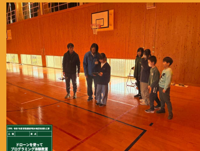
ドローンを使って プログラミング体験教室