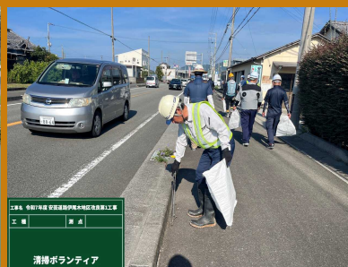
清掃ボランティア