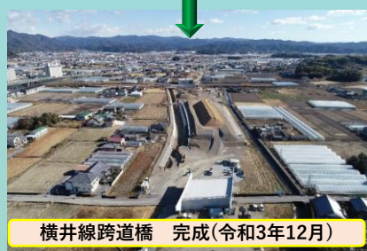
横井線跨道橋 完成(令和3年12月)