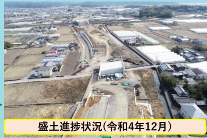
盛土進捗状況(令和4年12月)