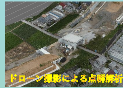
ドローン撮影による点群解析