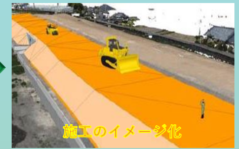
施工のイメージ化