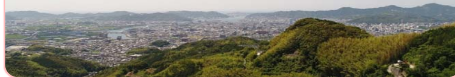
正連寺地区航空写真